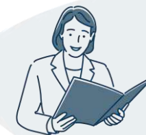
RESPONSABLE LOCAL SAAD