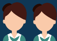
Aides à domicile