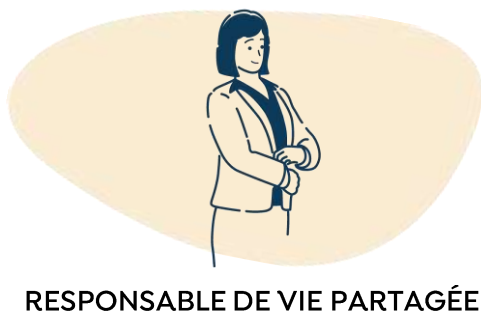
RESPONSABLE DE VIE PARTAGÉE