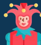
Animations Activités locales