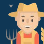
Agriculteurs Circuit court